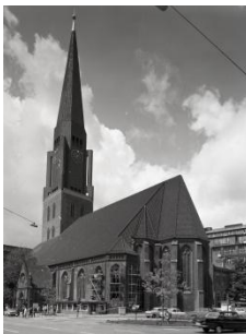
St. Jacobi-Turm (1961)

und Ansprüchen als ambitionierte Künstler begegneten, stellt ihre Arbeit eine idealtypische Positionierung dar. Sie ist für vier