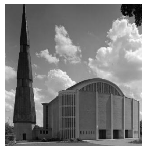
St. Marien HH-Ohlsdorf (1962)

wie z.B. die Johanneskirche in Hamm/ Westfalen von 1938 oder für den Jacobi-