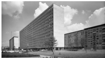
Grindelhochhäuser (ca. 1950)

Haltung ihrer Bauherren und Architekten in jeder