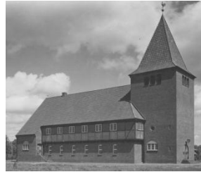
Lutherkirche HH-Wellingsbüttel (1937)

Vor allem im Großraum Hamburg tätig, haben Hopp und Jäger dabei von Mecklenburg über Schleswig-Holstein bis Westfalen und Franken bedeutende Aufträge realisiert. Sie sind mit insgesamt etwa 50 Neubauten bzw. prägenden Renovierungen von Kirchen überdurchschnittlich präsent. Zahlreiche von Hopp und Jäger realisierte Kirchenbauten stehen inzwischen unter Denkmalschutz. Für einzelne Bauten,